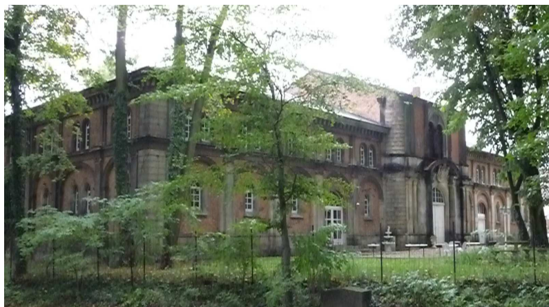
Rys. 3. Widok lewego skrzydła ujeżdżalni (fot. 2009r.). Fig.3. The view of the left part of the riding-school (the photo 2009).