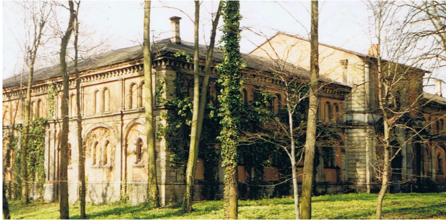
Rys.1. Widok lewego skrzydła obiektu wraz z maneżem zamkniętym (fot. 1998r.). Fig.1. The view of the object's left part together with the manege (photo 1998).

W części architektonicznej zamieszczono projekt zmian w istniejącej funkcji obiektu [1]. Obejmuje on zagospodarowanie prawego skrzydła ujeżdżalni koni na część hotelowo-restauracyjną. Na parterze w lewym skrzydle zaprojektowano foyer, kasy i szatnię oraz toalety. W części tylnej skrzydła umieszczono zaplecze remontowo-krawieckie. Środkowa część po maneżu do ujeżdżania koni przeprojektowana została na salę teatralną z możliwością dowolnej aranżacji przestrzeni: od układu arenowego po barokowy scena – widownia. W lewym skrzydle na piętrze zaprojektowano pomieszczenia techniczne obsługi teatru i garderoby aktorów.