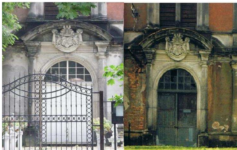
Rys. 4. Widok bramy wejściowej do maneżu. Po prawej widok obecny, po lewej z 1998r. Fig.4. The view of the entrance gate to the horsemanship. After right the present view, after left from 1998.

remontowe. Wykonano już częściowy remont sal, dzięki czemu budynek funkcjonuje z powodzeniem, jako miejsce odbywania się przyjęć weselnych. Szczególnie zmiany są widoczne na podstawie bramy wejściowej do maneżu (rys.4).